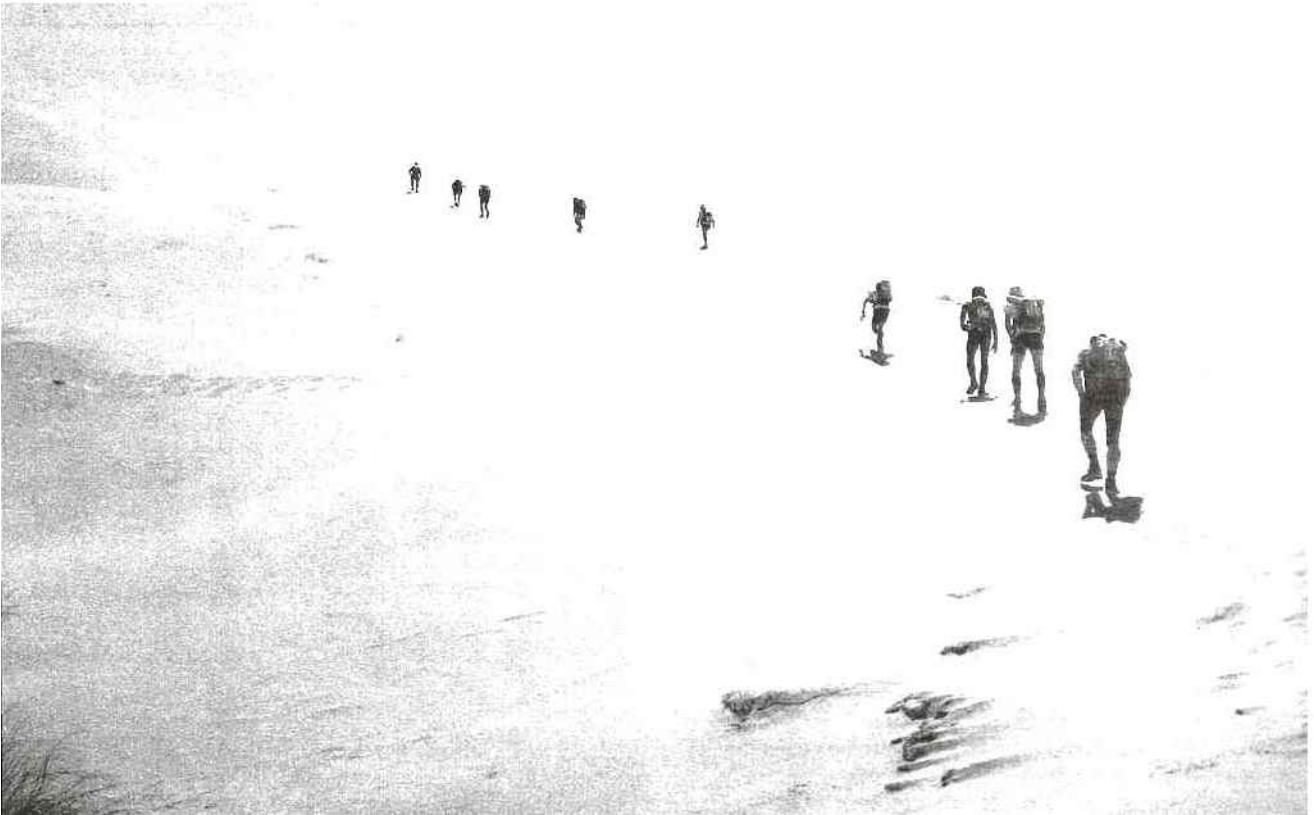
Des paysages splendides... à couper le souffle !